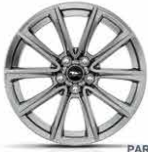
PARA LA VERSIÓN V8 (Disponible en Febrero 2015) Rines de aluminio pintado 19 pulgadas.