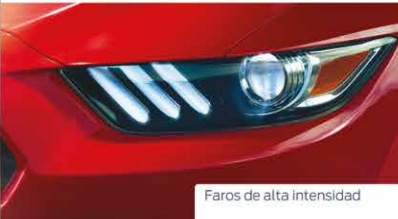
Faros de alta intensidad