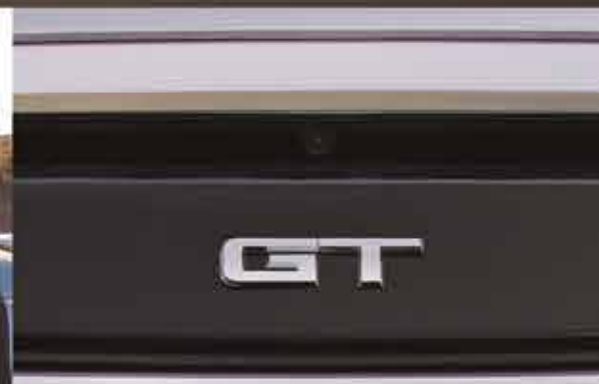
Emblema de cubierta trasera versión GT