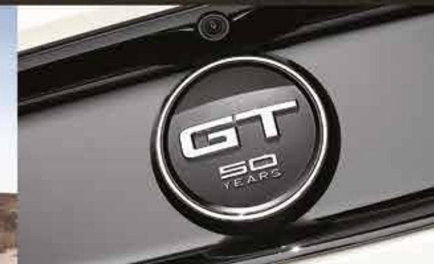
Emblema de cubierta trasera edición GT 50 años