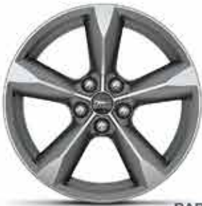
PARA LA VERSIÓN V6 Rines de aluminio fundido maquinado satinado de 18 pulgadas