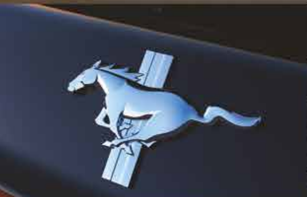
Emblema de cubierta trasera versión V6