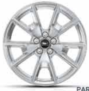
PARA LA VERSIÓN V8 (Paquete de apariencia 50 años) Rines de aluminio pintado en níquel brillante de 19 pulgadas.