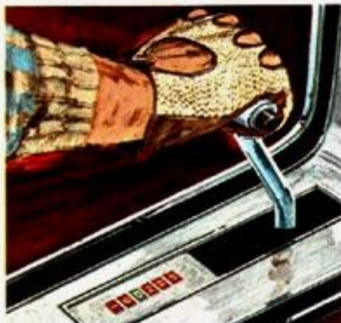
Drei Extras: Verstellbare Lenksäule, sie schwenkt zur Seite, wenn Sie die Tür öffnen (oben), Sport-Automatik (links) und Radio-Konsole (links unten).