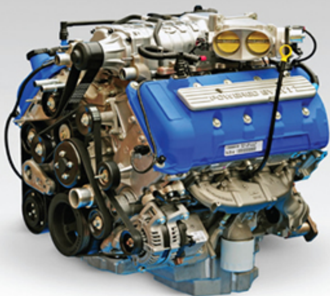
Motor supercargado 5.8L V8 650hp