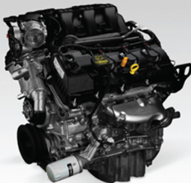
Motor TiVCT 3.7L V6 305hp