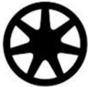
Black Accent Package wheel available on GT 19" x 8.5" Ebony Black-Painted Aluminum

قياسه مع كل سيارات EcoBoost مخلف من الالومنيوم قياس 19 * 9 بوصه مطليه باللون الاسود اللامع