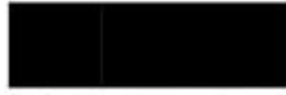
Ebony Carbon Weave cloth with Mko suede inserts مقاعد بالقماش الأسود الكربوني مع إدراجات من مخملي Mko الأسود