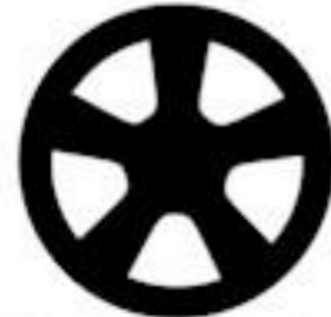
Optional with GT when not equipped with Black Accent Package 18" x 8" Machined-Face Aluminum with Low-Gloss Ebony Black-Painted Pockets

قياسه مع GT من الخلف الاساسي مخلف من الالومنيوم المشغول قياس 18 * 8 بوصة مع حوب مطليه باللون الاسود اللامع