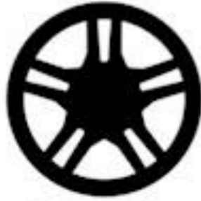
Standard with GT Base 18" x 8" Machined-Face Aluminum with High-Gloss Ebony Black-Painted Pockets

Restrictions apply. Some options whilst shown as available, may not be compatible together. For more clarification, please visit your local Ford Distributor.