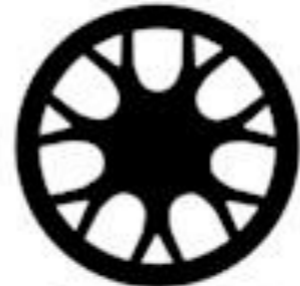
Standard on all EcoBoost 19" x 9" Low-Gloss Ebony Black-Painted Aluminum

التيار مع GT عندما لا تكون مجهزة بمجموعة اللمسات السوداء مخلف من الالومنيوم المشغول قياس 18 * 8 بوصة مع حوب مطليه باللون الاسود اللامع