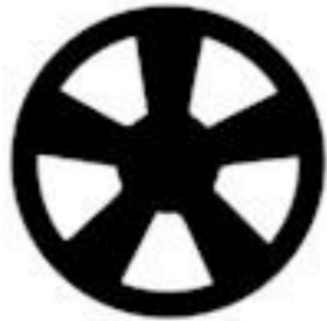
Optional with GT when not equipped with Black Accent Package 19" x 8.5" Polished Aluminum

مخلف بمجموعة اللمسات السوداء متوفرة مع GT مخلف من الالومنيوم المطلي باللون الاسود اللامع قياس 19 * 8.5 بوصة