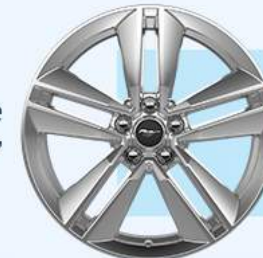
GT V8 /Convertible Aluminio 19"