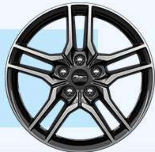
EcoBoost® Aluminio 18"