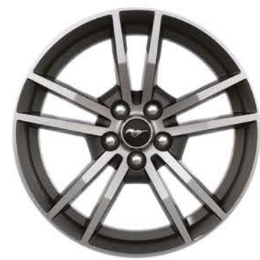
VERSIÓN ECOBOOST® 18 PULGADAS