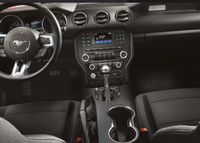
Interior en Tela color Negro Disponible para V6