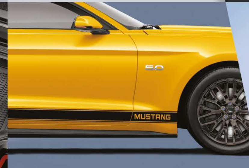
GRÁFICOS: Personaliza tu Mustang con una gran variedad de diseños audaces.