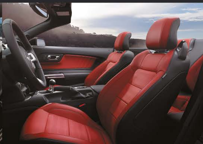
Interior en Piel con Insertos en color Rojo. Disponible para GT Premium V8 (sólo en color exterior Blanco Oxford, Gris Imán, Plata Estelar y Negro)