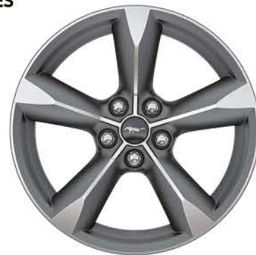
VERSIÓN V6 18 PULGADAS