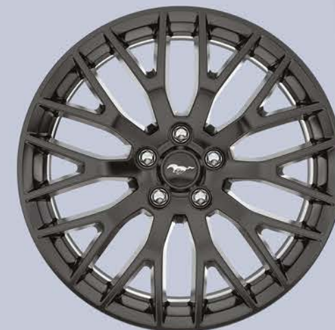
RINES DE 19 PULGADAS: Realza la apariencia de tu Mustang y llévalo a un nivel superior.