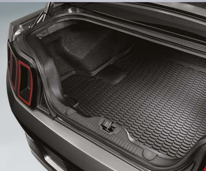
TAPETES PROTECTORES DE CAJUELA: Protege la alfombra del área de carga contra derrames de líquidos y transporte de material, fáciles de lavar e instalar.