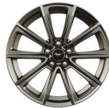
VERSIÓN V8 19 PULGADAS