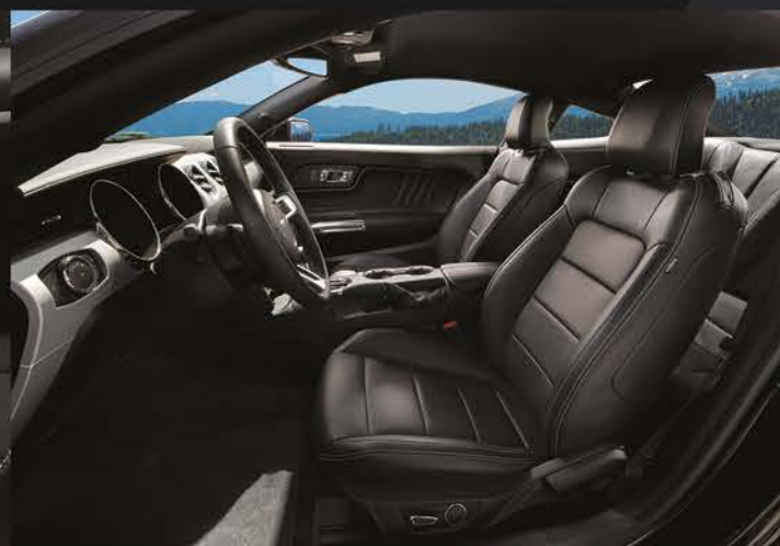
Interior en Piel color Negro Disponibles para EcoBoost® y GT Premium V8