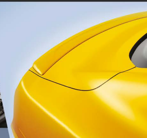
ALERÓN: Estilo deportivo en su totalidad.