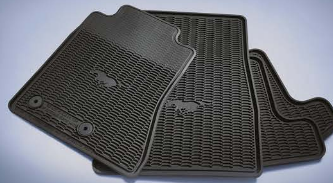
TAPETES DE HULE TODO CLIMA: Protege el interior contra polvo, lodo y humedad. Su sistema de fijación al piso brinda seguridad al conducir.